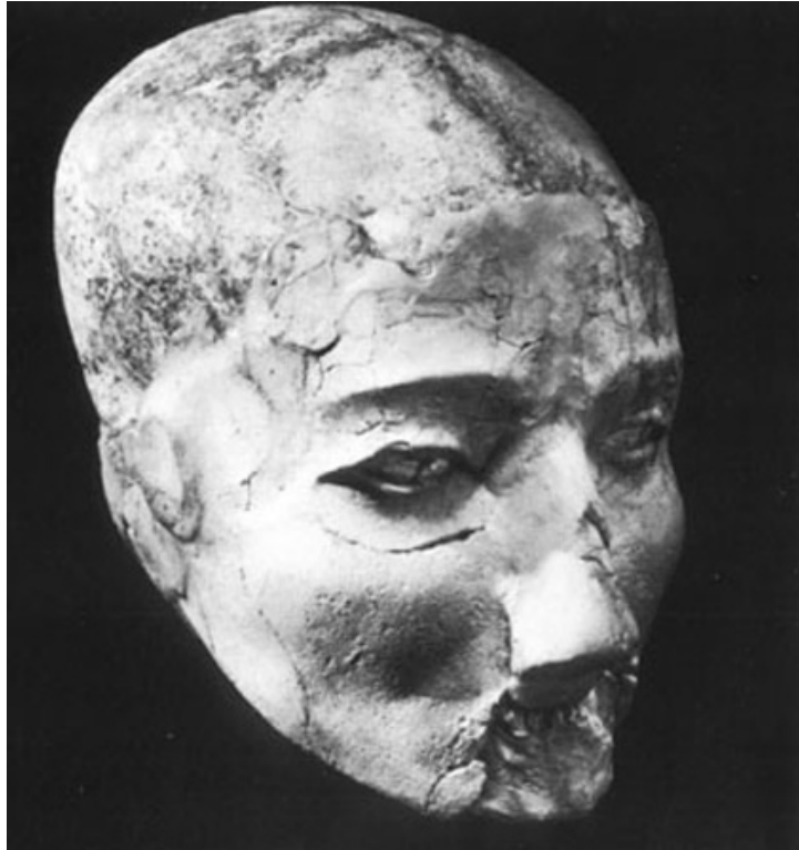
Fig.8. Cráneo con tratamiento ritual. Jericó

Lo que son o se ha llamado "fluidos magnéticos" no necesita explicación aquí. La Física moderna se sirve de la electricidad de una forma mucho más completa de la que se podían servir los Magos de la India o de Persia. Pero la electricidad, cuya naturaleza, a pesar de todos los avances de nuestra ciencia moderna, aún no se conoce. Y este es solo uno de los múltiples fenómenos de la naturaleza que los practicantes de la magia supieron aprovechar.