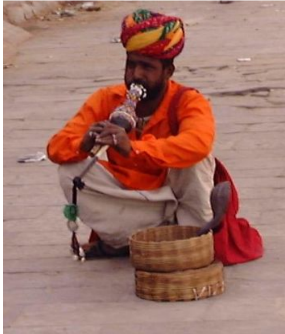
Fig.7. Encantador de serpientes. India

,o la melodía que duerme a un niño o que aparentemente vuelve inofensiva a la serpiente( ya que sabemos que este animal es sordo y solo sigue los movimientos de la flauta del encantador ), animal mágico por excelencia, también, cuya mirada inmoviliza y fascina.