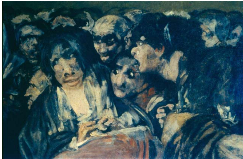
Fig.9. Aquelarre. Francisco de Goya

se realizaba con el mayor cuidado, debería tener siempre el resultado apetecido. Solo era necesario conocer las afinidades misteriosas que unían a todos los seres para poner en movimiento los mecanismos del universo. Eso, al fin y al cabo, es lo que se conoce y ha conocido por "magia", en su origen también una forma de lo que denominamos religión.