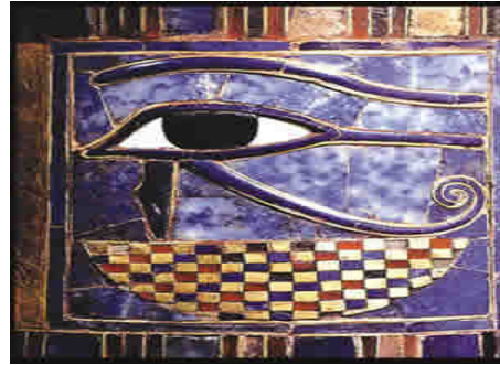
Fig.5 Ojo mágico en un brazalete egipcio

animados: fuerzas como la del canto que apacigua a las fieras, cuyo poder conocemos por la leyenda de Orfeo o la del poder de la mirada que fascina, que luego dio origen a la creencia en el "Mal de ojo", que aún perdura en nuestras sociedades y tan popular fue en Egipto, civilización de la que se conservan numerosos documento adornados con el Ojo Mágico.