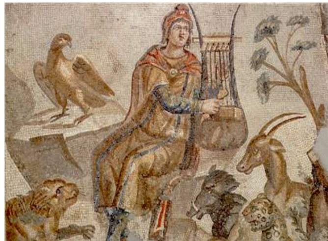
Fig. 6. Orfeo. Mosaico romano