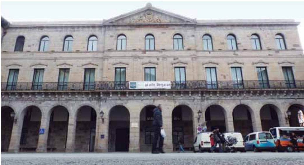
Azken 40 urteotan moduan, Errege Seminarioan jarraituko du UNED-Bergarak, herriaren bihotzean.