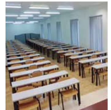
Aretoa nagusia apur bat handituko da.