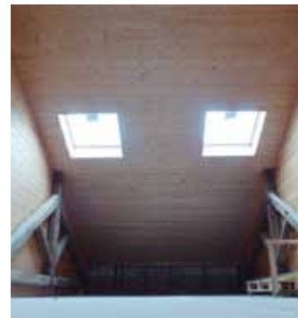
Ikasgelak ere egokitu egingo dira.