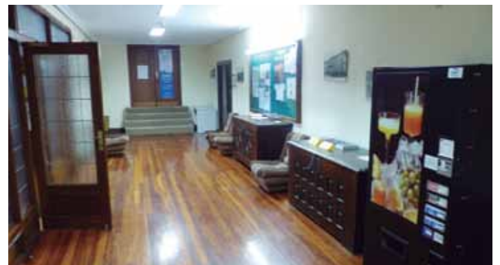
Aitzariak berritzeko beharra ere badago.

kailerek jasan beharreko bolumenaren arabera kalkulu bat egin zuten eta ez du gaitasunik bolumen horri erantzuteko. Horregatik, segurtasun lege guztiak beteko dituen eskailera berria jarri beharko dugu", dio Esparzak. Garai baten aztertu zen kanpotik eskailera berri bat egokitzea, baina teknikoki ia ezinezkoa zen. Eskailera berriak hiru pasabide izan beharrean bi izango ditu, gaur egungoaren zabalera berberarekin.