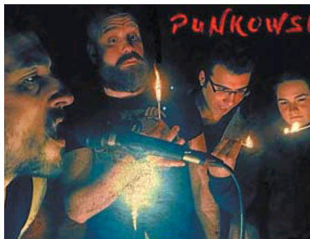
Punkowsky. Un visión personal creada e interpretada por Borobia.

«Quiero decir que lo que nos acerca a la victoria es la acumulación de fracasos y poco más. Puede que con eso baste, quizás esto sólo sea otro fracaso de los integrantes y bien a gusto que se recibirá», destaca en su pre-