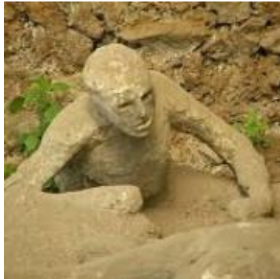
Centro Asociado de Baleares (directo)

https://extension.uned.es/actividad/idactividad/16344