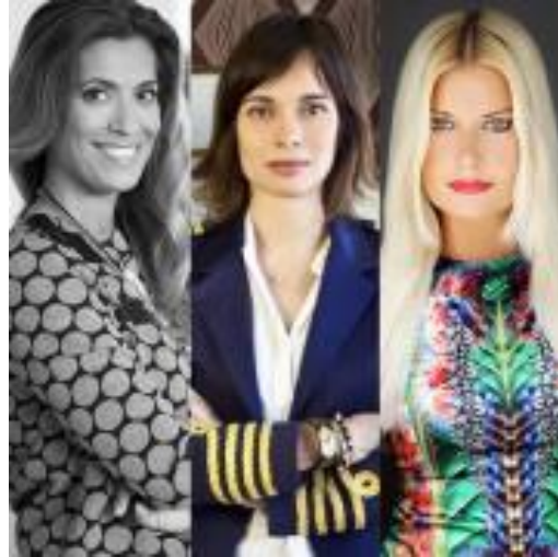
Centro Asociado de Tudela (directo)

http://extension.uned.es/actividad/idactividad/17028