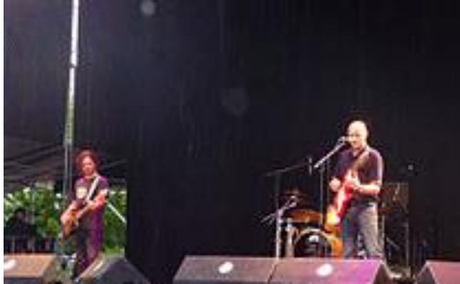
Centro Asociado de A Coruña (diferido)

http://www.intecca.uned.es/portavip/directos.php?ID_Grabacion=73309&ID_Sala=204247