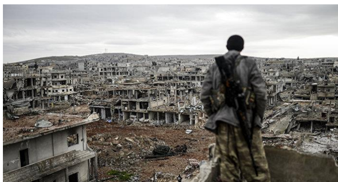
Centro Asociado de Vila-real (diferido)

https://www.intecca.uned.es/portavip/grabacion.php?ID_Grabacion=192430&ID_Sala=3&hashData=9a529befe46452a9539298f0bf10b05c&paramsToCheck=SURfR3JhYmFjaW9uLEIEX1NhbGEs