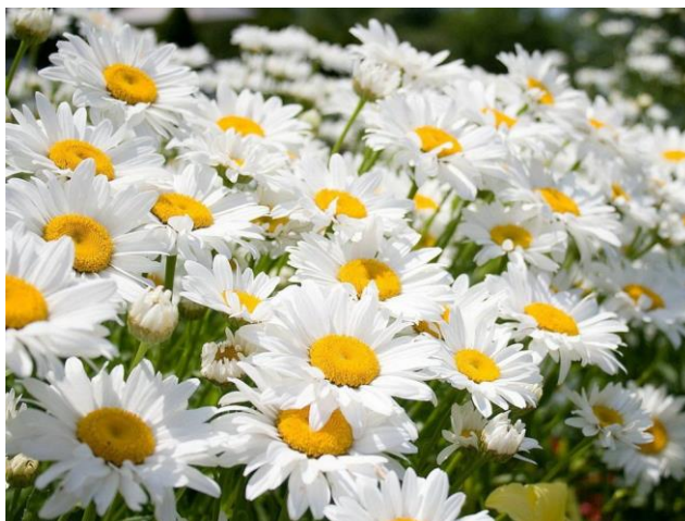
Centro Asociado de Tudela (diferido)

https://www.intecca.uned.es/portavip/grabacion.php?ID_Grabacion=192467&ID_Sala=3&hashData=3190de545a2eb05b59da6a34e873c62&paramsToCheck=SURfR3JhYmFjaW9uLEIEX1NhbGEs