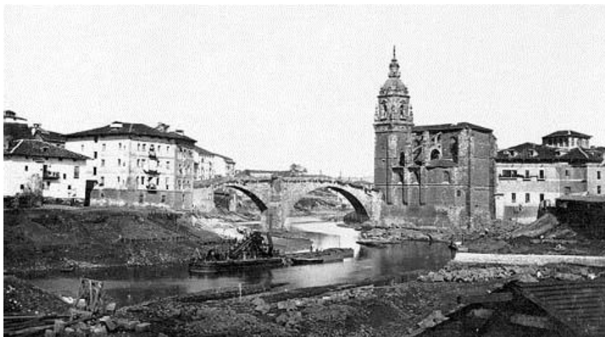
Centro Asociado de A Coruña (diferido)

https://www.intecca.uned.es/portavip/grabacion.php?ID_Grabacion=171865&ID_Sala=3&hashData=2cfc40fa52b7f93466cda42d3ce6b390&paramsToCheck=SURfR3JhYmFjaW9uLElEX1NhbGEs