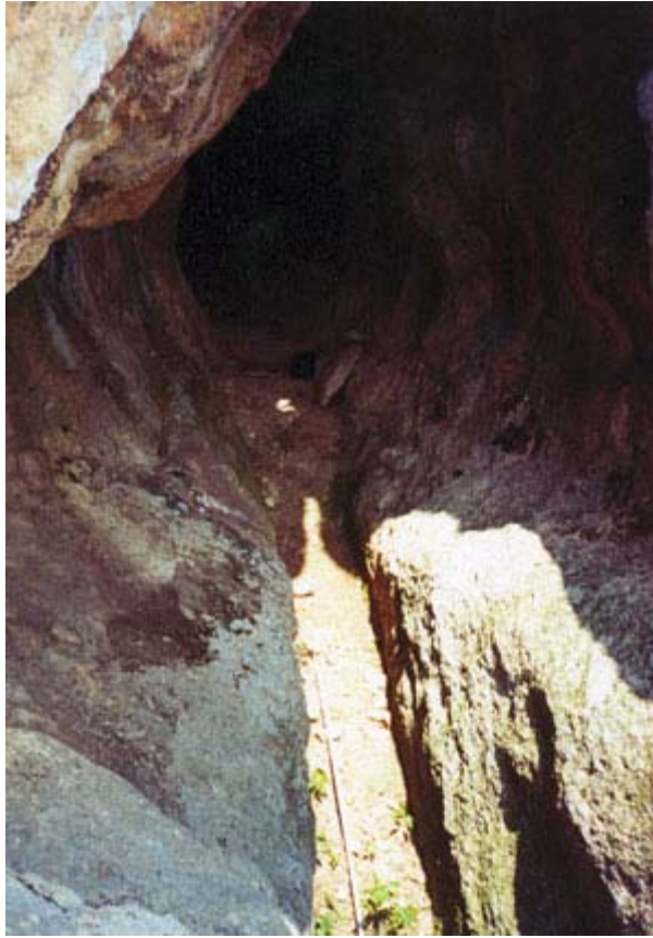
Fig.3. El falo solar acercándose al altar-útero dentro de la cueva. Villa de Nenkovo, Kurdzhali.

Cuando al sol se alza más, y la luz se extiende por el interior de la cueva, el falo se alarga y llega al altar que simboliza el útero.