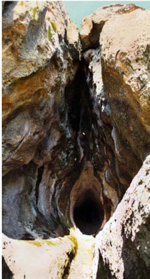
Fig.2. El Útero de Roca, Nenkovo, Kurdzhal, Bulgaria .

Indudablemente, unas manos humanas continuaron la obra del agua que excavó el lugar durante milenios. Al final de la cueva, un altar excavado en la roca simboliza el útero mismo.