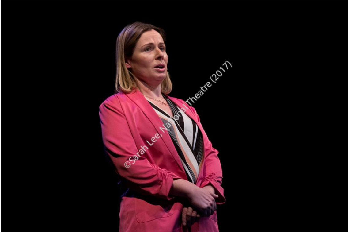
Imagen 36: Gayle en Consent (2017). Imagen extraída de National Theatre, Consent Research Pack , p. 48. Accedido: 14 de mayo de 2019.