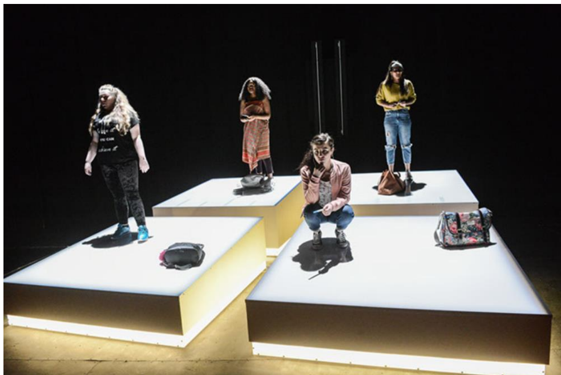
Imagen 19: Escenografía de la puesta en escena. Imagen extraída de http://www.miriamnabarro.co.uk/i-told-my-mum-i-was-going-on-an-re-trip/wzubivdf37tv7po16xghtasl0ctapr . Accedido: 16 de mayo de 2019.