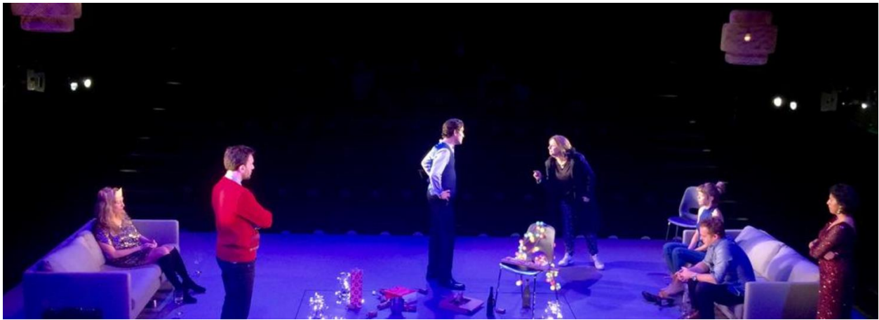
Imagen 37: Diseño de escenario de Consent (2017). Imagen extraída de: https://www.ald.org.uk/show/161/17973/consent . Accedido: 14 de mayo de 2019.