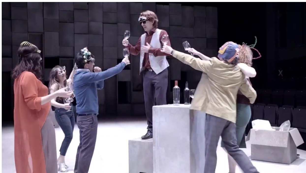
Imagen 28: Fiesta navideña en Consentimiento (2018). Imagen extraída de: https://youtu.be/7DV6vR_zqeQ . Accedido: 14 de mayo de 2019.