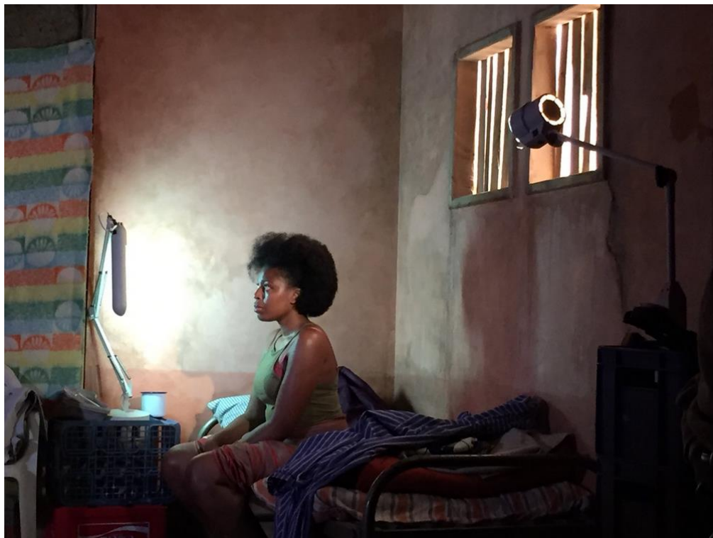
Imagen 21: Cousin en la clínica clandestina. Imagen extraída de: http://www.miriamnabarro.co.uk/i-told-my-mum-i-was-going-on-an-re-trip/xdfld3617xixyo9qz87wxzpak09wki . Accedido: 16 de mayo de 2019.