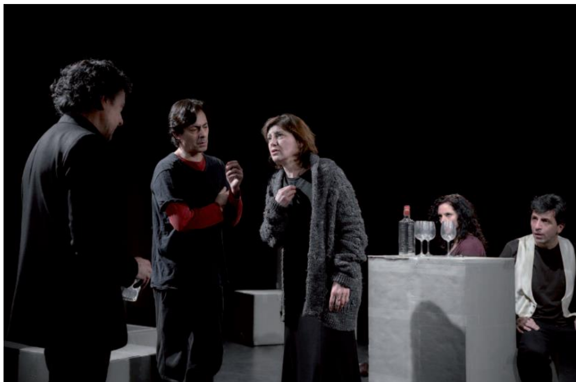
Imagen 26: Adela en Consentimiento (2018).