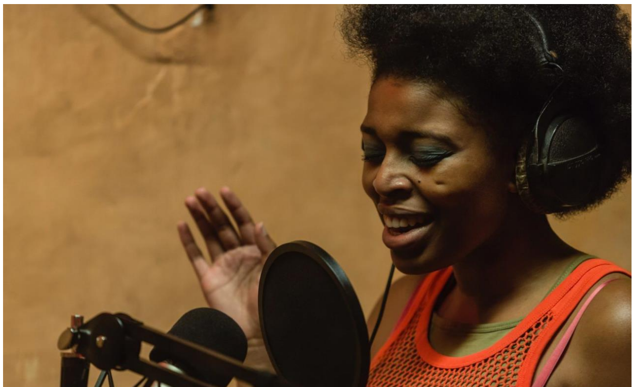
Imagen 14: Cousin en la producción de BBC TWO. Imagen extraída de http://www.20storieshigh.org.uk/show/i-told-my-mum-i-was-going-on-an-r-e-trip-television-broadcast/ . Accedido: 16 de mayo de 2019.