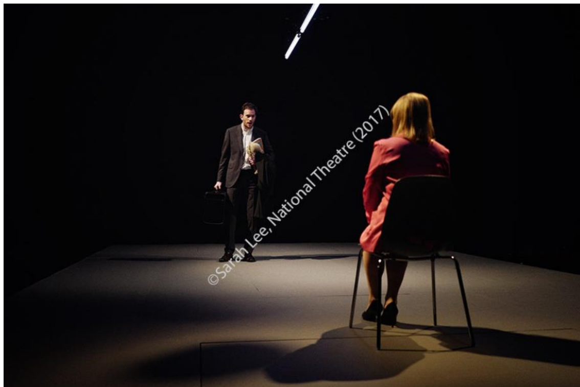
Imagen 25: Gayle en Consent (2017). Imagen extraída de National Theatre, Consent Research Pack , p. 56. Accedido: 14 de mayo de 2019.