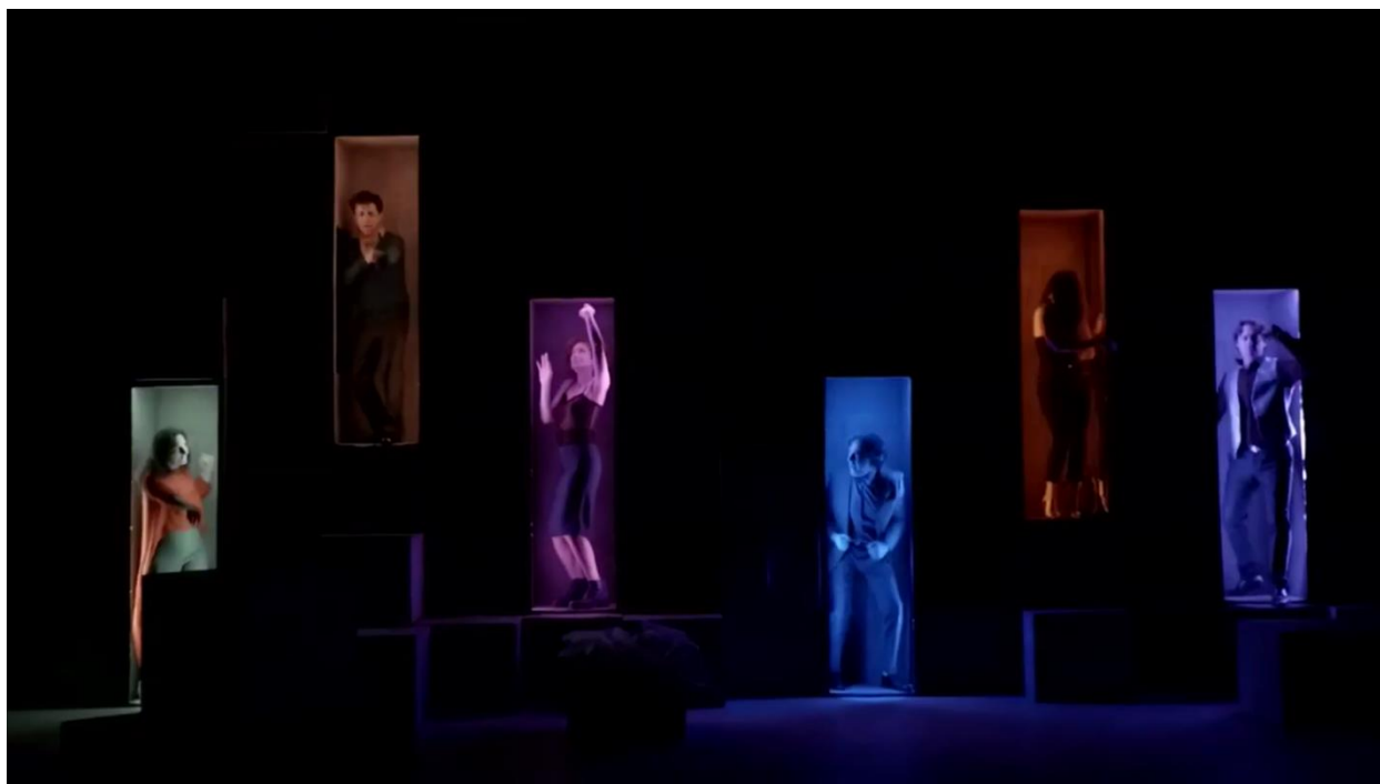
Imagen 41: Diseño de escenografía e iluminación en Consentimiento (2018). Imagen extraída: https://youtu.be/7DV6vR_zqeQ . Accedido: 14 de mayo de 2019.