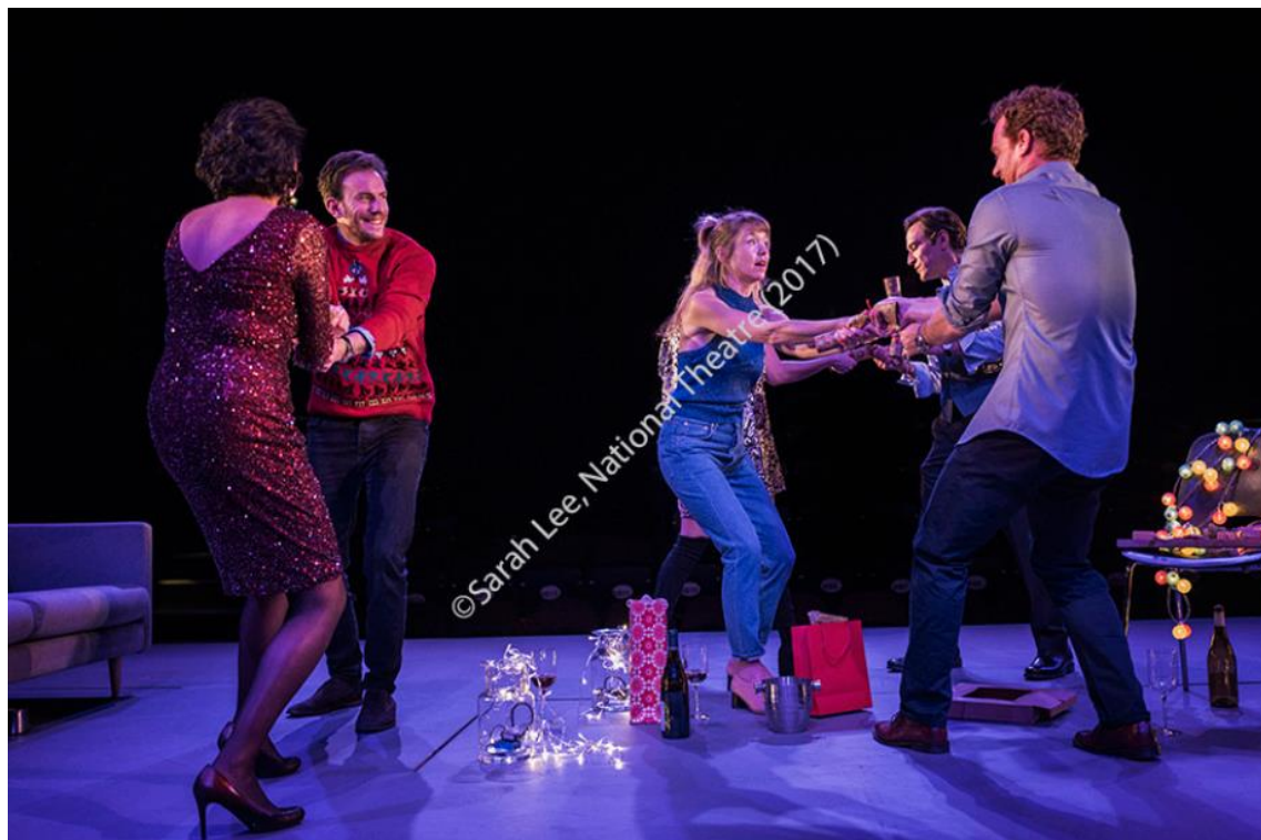
Imagen 27: Fiesta navideña en Consent (2017). Imagen extraída de National Theatre, Consent Research Pack , p. 57. Accedido: 14 de mayo de 2019.