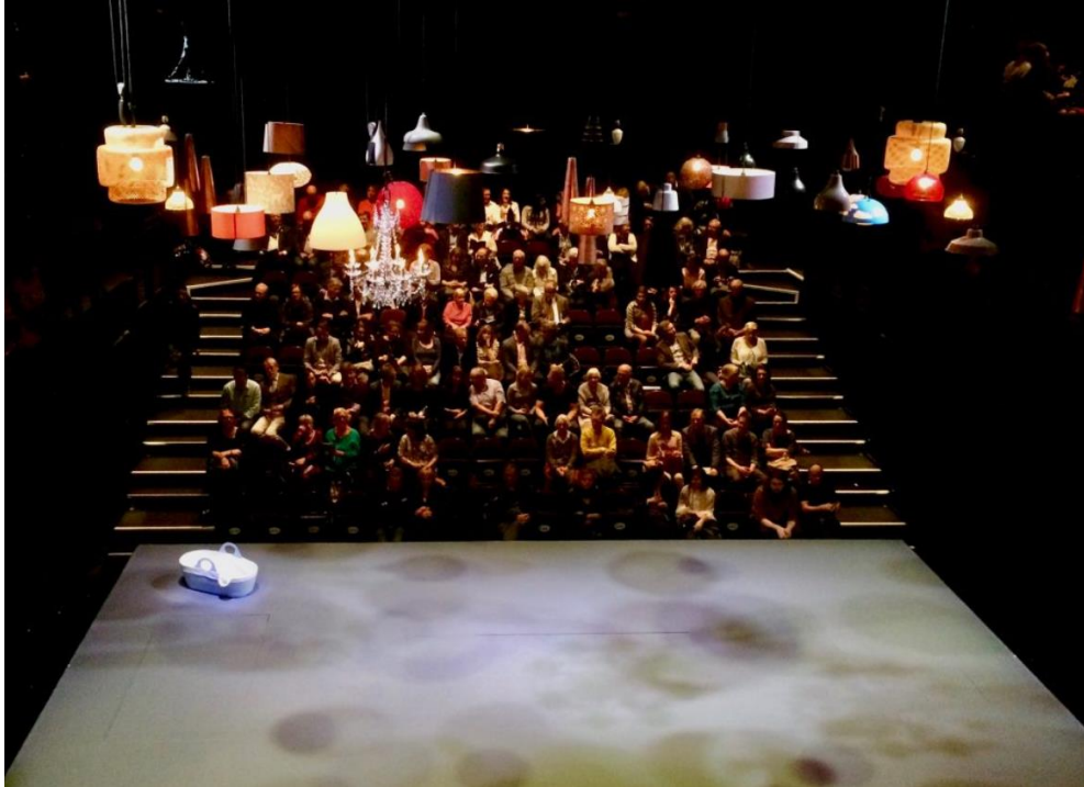
Imagen 38: Diseño de escerario y luces de Consent (2017). Imagen extraída de: http://blogs.carleton.edu/londonprogram17/2017/04/15/consent-it-just-got-real/ . Accedido: 14 de mayo de 2019.