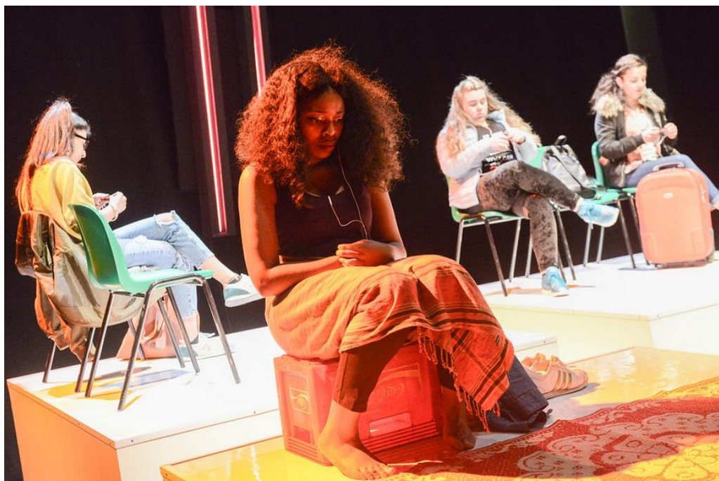
Imagen 17: Cousin en la puesta en escena. Imagen extraída de http://www.20storieshigh.org.uk/show/i-told-my-mum-i-was-going-on-an-r-e-trip-television-broadcast/ . Accedido: 16 de mayo de 2019.