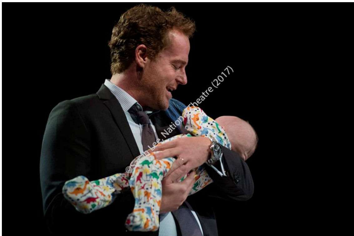
Imagen 40: Bebé de Nina Raine en Consent (2017).