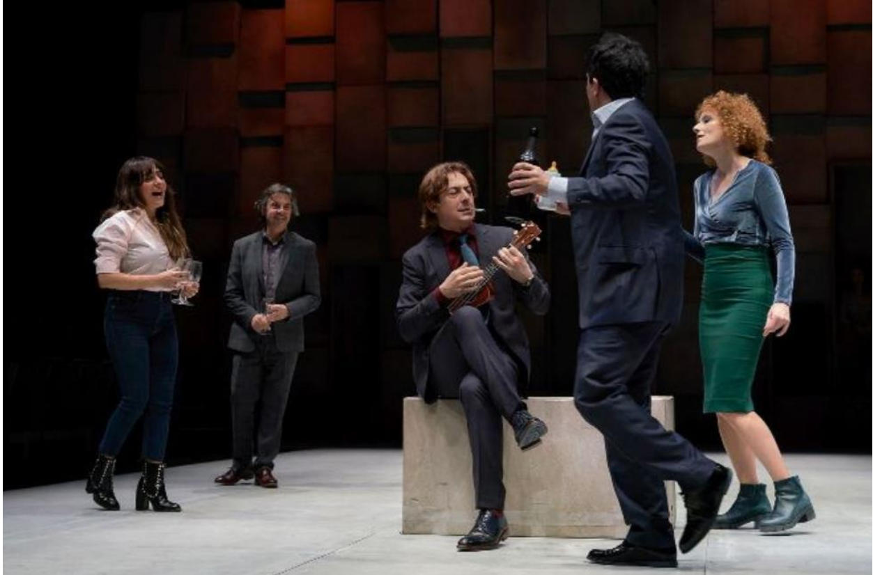
Imagen 42: Escena de la canción en Consentimiento (2018). Imagen extraída: https://www.elmundo.es/madrid/2018/03/11/5aa27612468aeb1d0a8b457e.html . Accedido: 14 de mayo de 2019.