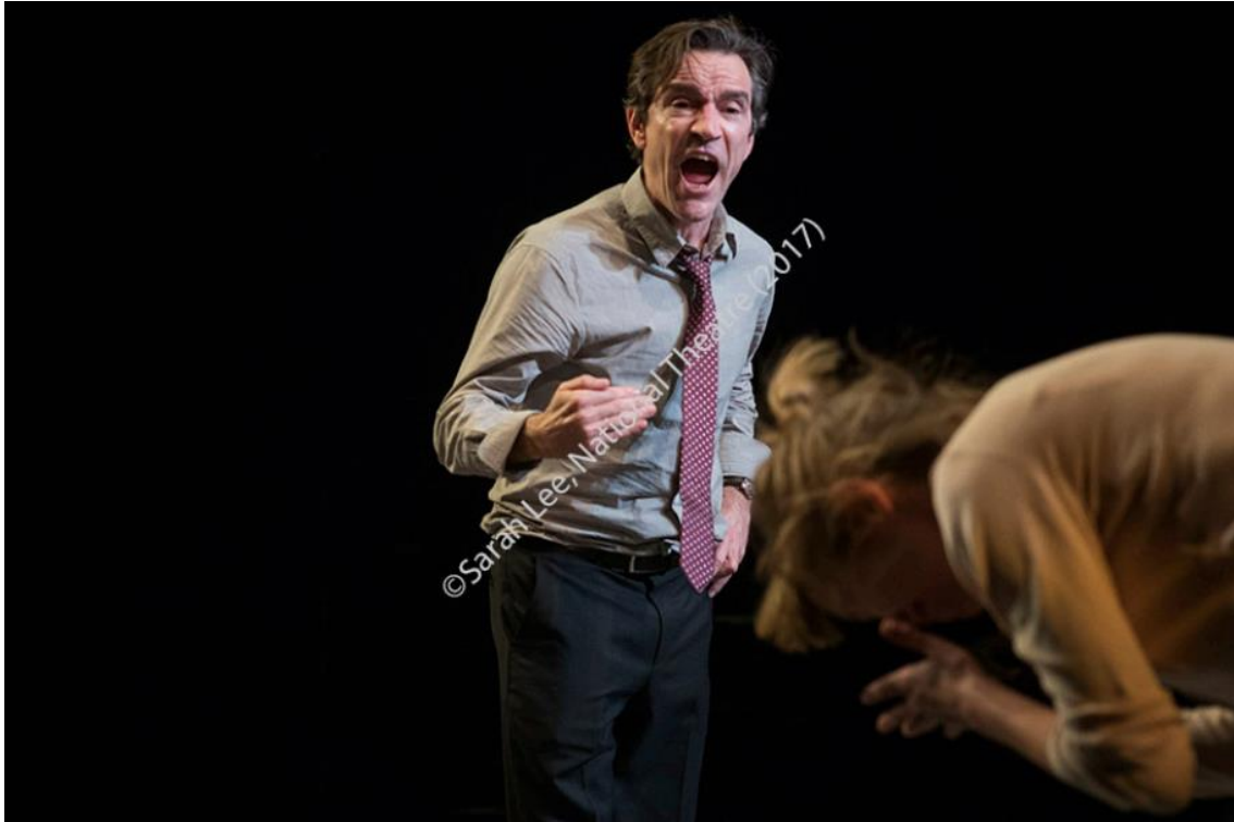
Imagen 23: Discusión entre Kitty y Edward en Consent (2017). Imagen extraída de National Theatre, Consent Research Pack , p. 54. Accedido: 14 de mayo de 2019.