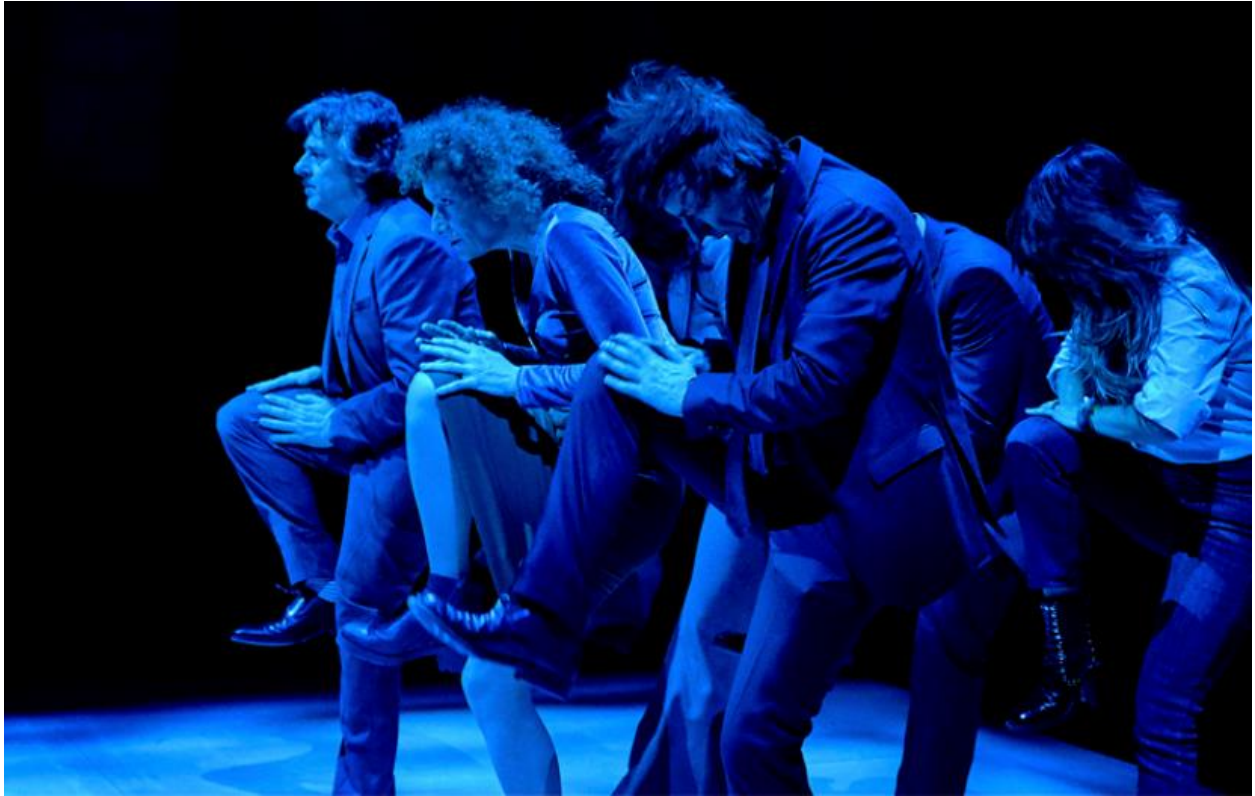
Imagen 29: Escena de movimiento dos en Consentimiento (2018). Imagen extraída de: https://cdn.mcu.es/espectaculo/consentimiento/ . Accedido: 14 de mayo de 2019.