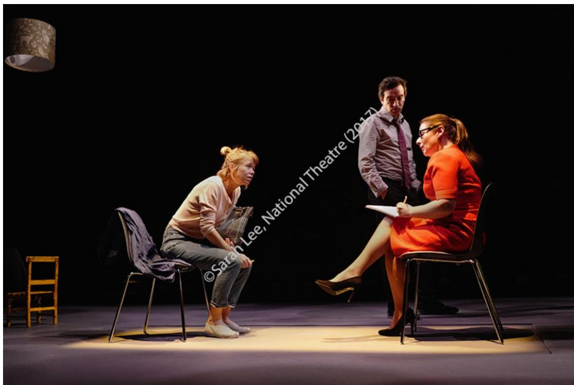
Imagen 32: Escena de Kitty y Edward hablando con Laura en Consent (2017). Imagen extraída de National Theatre, Consent Research Pack , p. 59. Accedido: 14 de mayo de 2019.