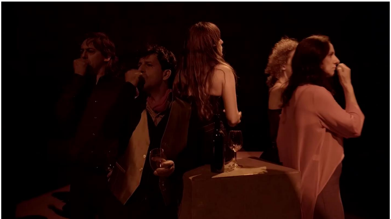
Imagen 30: Escena de movimiento seis en Consentimiento (2018). Imagen extraída de: https://youtu.be/7DV6vR_zqeQ . Accedido: 14 de mayo de 2019.