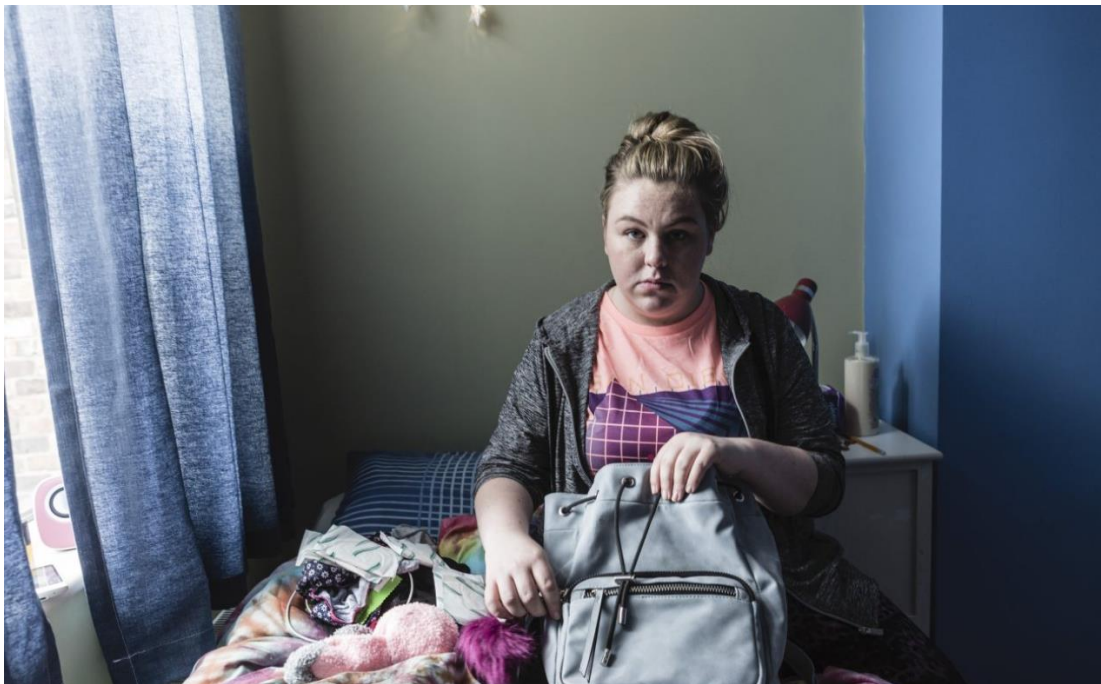
Imagen 16: Paige en la producción de BBC TWO.