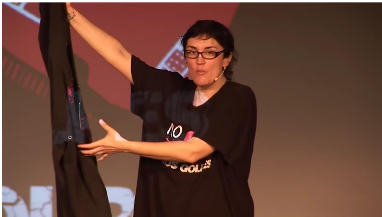
Imagen 3: Chaqueta que usa para transformarse en Antonio y Antoñita.