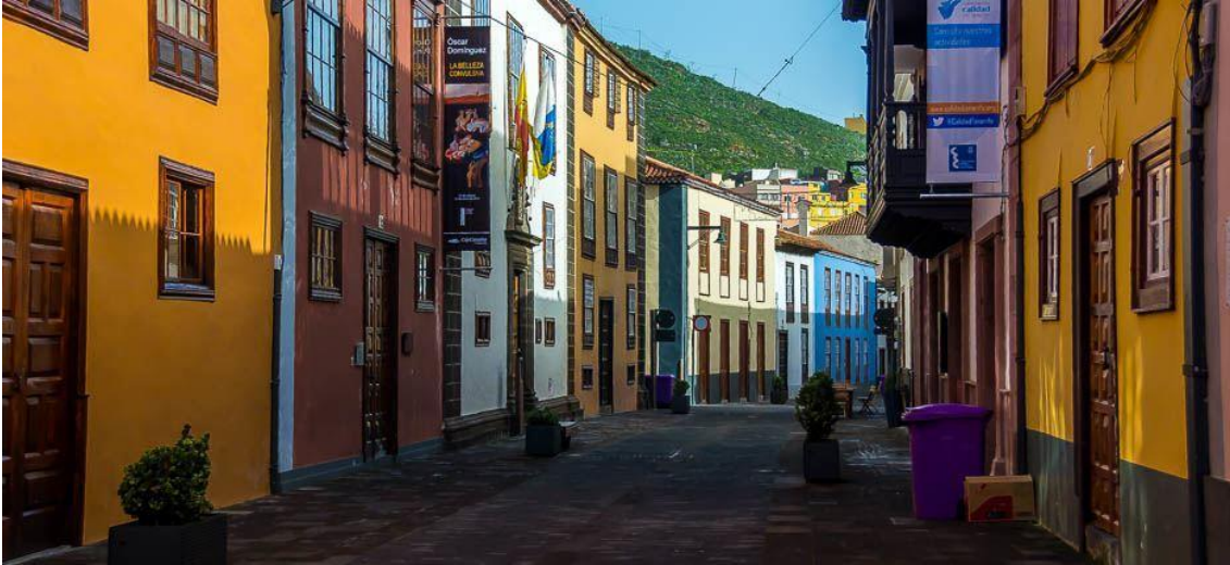
Centro Asociado de Tenerife (diferido)

https://www.intecca.uned.es/portavip/grabacion.php?ID_Grabacion=241482&ID_Sala=3&hashData=34e437343c251fd11bad955f30fe91ca&paramsToCheck=SURfR3JhYmFjaW9uLElEX1NhbGEs