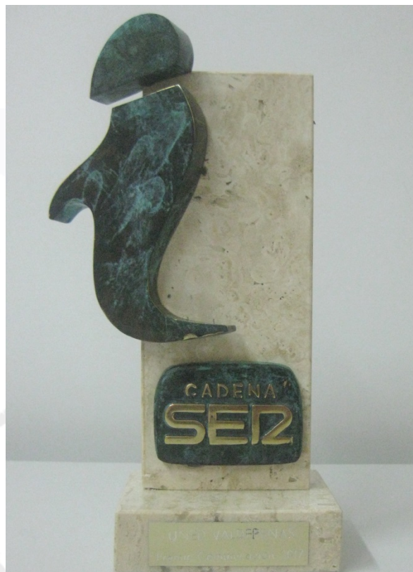
Foto 2: Galardón otorgado al Centro Asociado por Cadena Ser Ciudad Real.