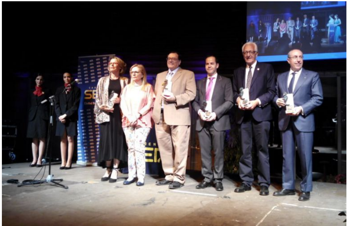
Foto 1: Premiados en la XIV Gala de los "Premios Comunicación" Cadena Ser 2017. 23 de junio de 2017.