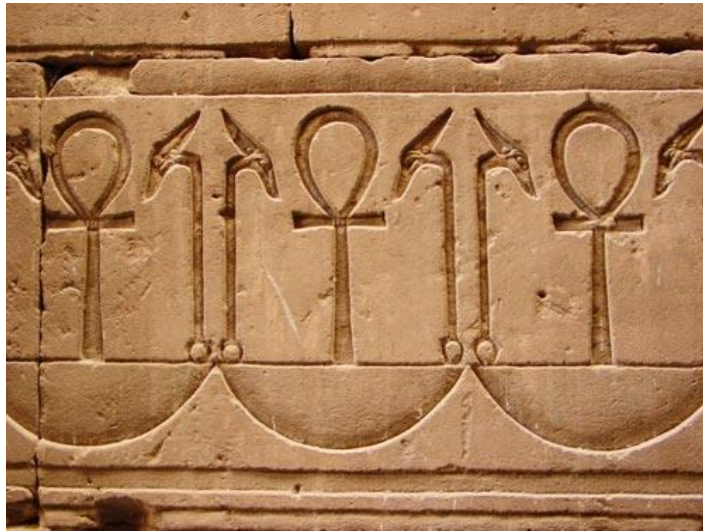
Centro Asociado de Baleares (directo)